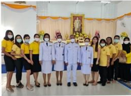
รพ.รัตภูมิ 5 ธันวาคม 2563 ณ.ศาลาประชาคม อ.รัตภูมิ